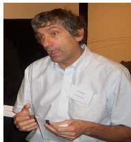
John M. Martinis

Fueron reconocidos por sus investigaciones sobre los bits cuánticos; descubrimiento del efecto túnel mecánico cuántico macroscópico y la cuantificación de energía en un circuito eléctrico.